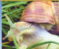
Schneckenhülle „Bist Du in Eile, gehe langsam“ Chinesisches Sprichwort